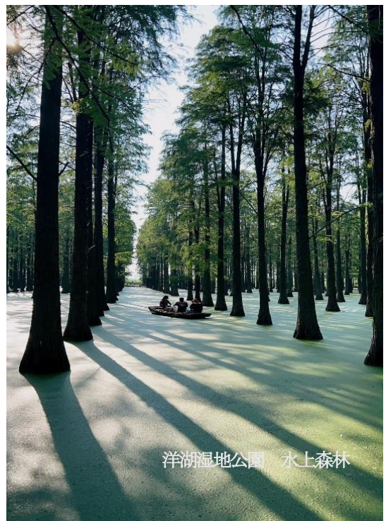
洋湖湿地公園 水上森林

私の家族は5人です。祖父母、両親、そして私。私たちは祖父母とは一緒に住んでいませんが、家はとても近く、徒歩わずか5分です。祖父母も高齢なので、今回も一緒にたくさん写真を撮り、素敵な思い出を残せました。今回私が中国に帰国した日は、たまたま母の誕生日でした。事前に伝えていなかったで、私を見た家族はとても驚き、信じられず「この人は誰？」と聞きあうことが数回往復しました。おばあちゃんは私をぎゅっと抱きしめてくれました。みんな嬉しかった！この時、私は中国に帰ることに本当に意味があると心の中で感じました。